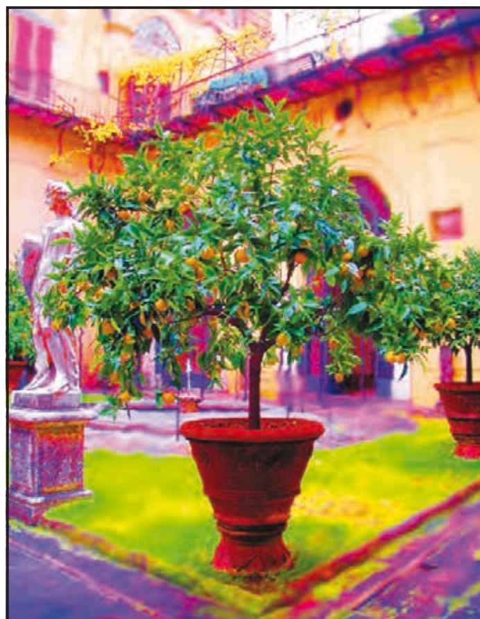
PALAZZO MEDICI RICCARDI