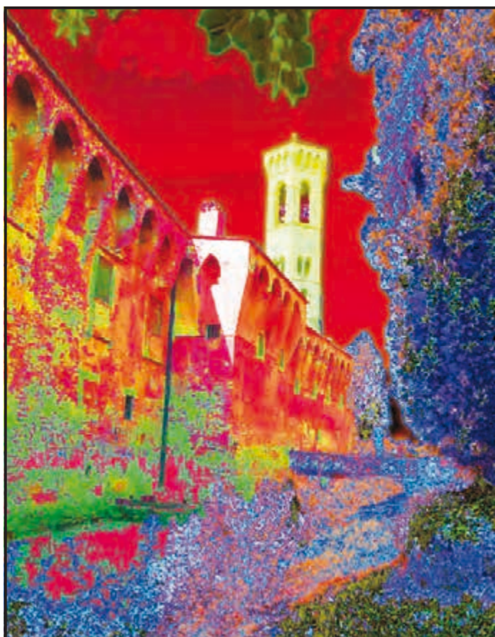
BADIA A SETTIMO